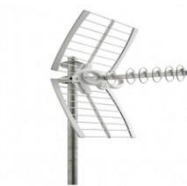
Sicherer, bester Empfang