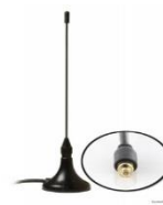
Bei starkem Signal